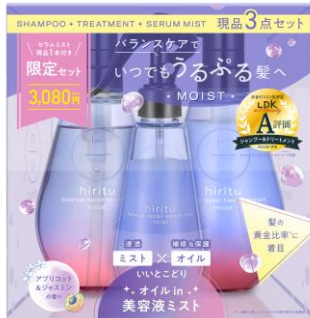
HIRITU バランスリペアセラムミスト モイスト リミテッドセット

シャンプー・ヘアトリートメントの価格でセラムミストが付いてくる！ お得な現品3点セットを数量限定で同時発売いたします。