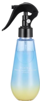
ヒリツ バランスリペアセラムミスト スムース 1,595円(税込) / 150mL