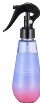
ヒリツ バランスリペアセラムミスト モイスト 1,595円(税込) / 150mL