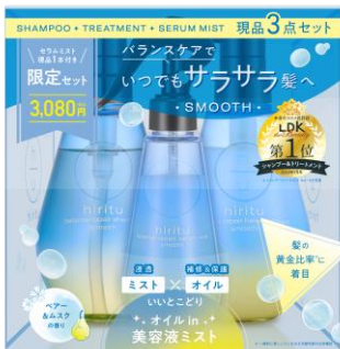
HIRITU バランスリペアセラムミスト スムーズ リミテッドセット