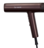
ルメント イオンジェナドライヤー 26,400円(税込)