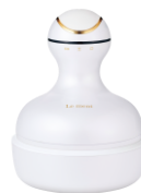
ルメント ヘッドスパ パールホワイト 10,780円(税込)